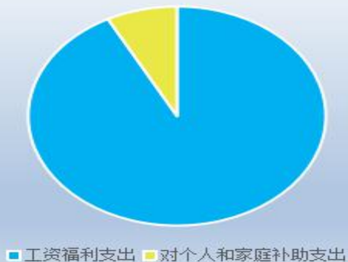
收入经济科目构成图