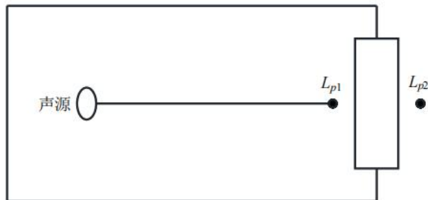
图 4-1 室内声源等效为室外声源图例

首先设靠近开口处（或窗户）室内、室外某倍频带的声压级或 A 声级分别为 L_{p1} 和 L_{p2} 。如图 4-1 所示。