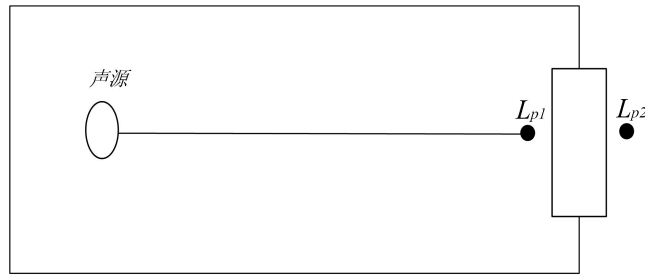
图 4-2 室内声源等效为室外声源的图例