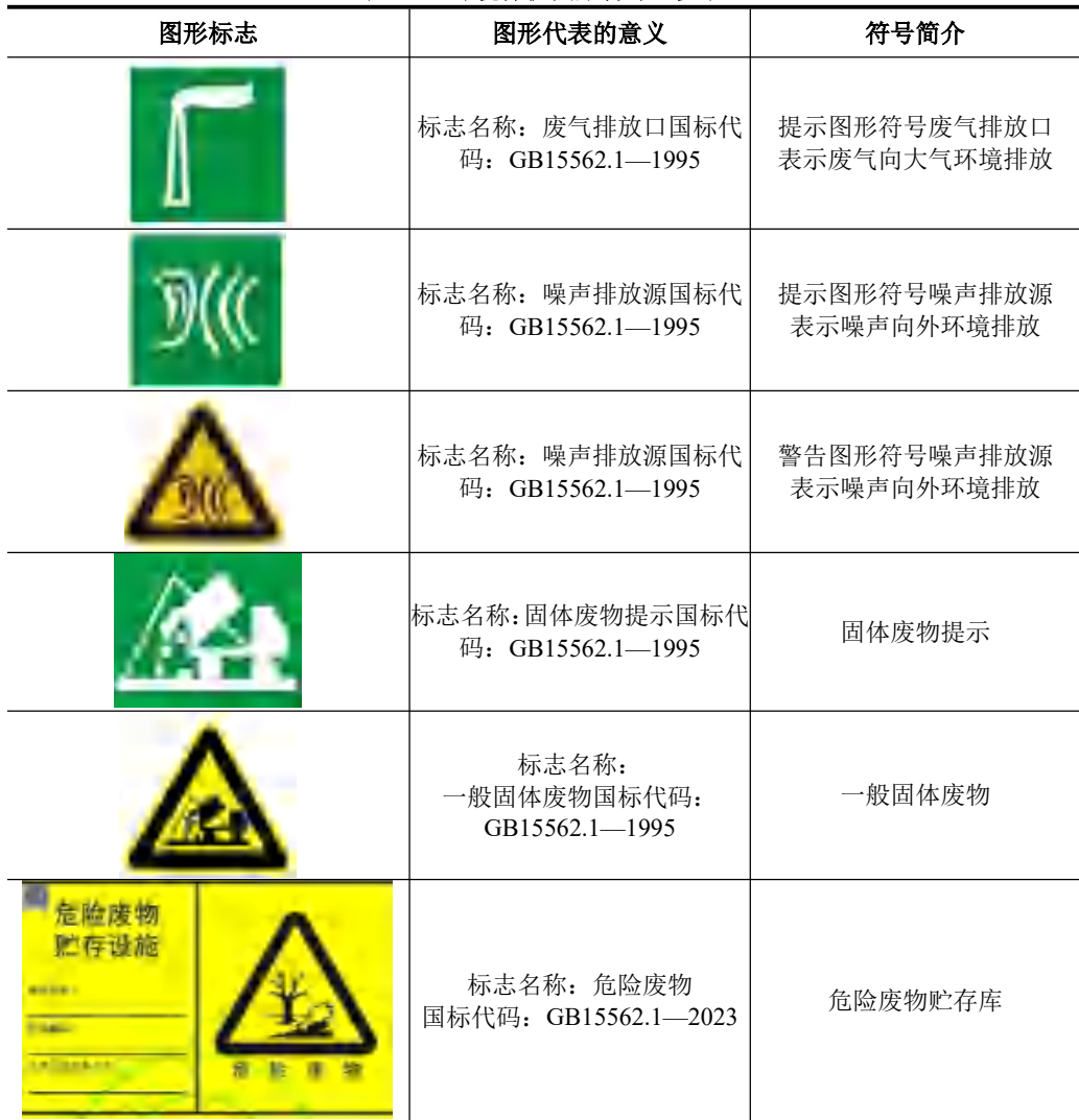
表 5-1 环境保护图形符号一览表