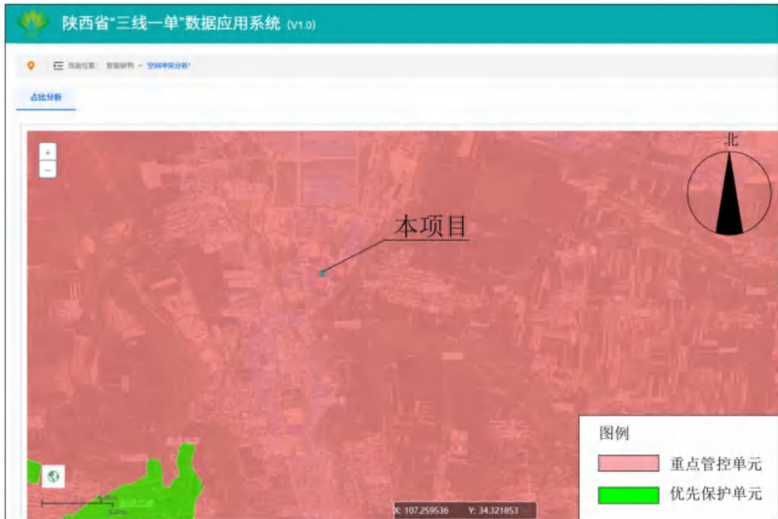
图 1-1 本项目与宝鸡市生态环境管控单元对照分析示意图

由图 1-1 可知，本项目涉及的环境管控单元为宝鸡市渭滨区重点管控单元 4，不涉及优先保护单元和一般管控单元。