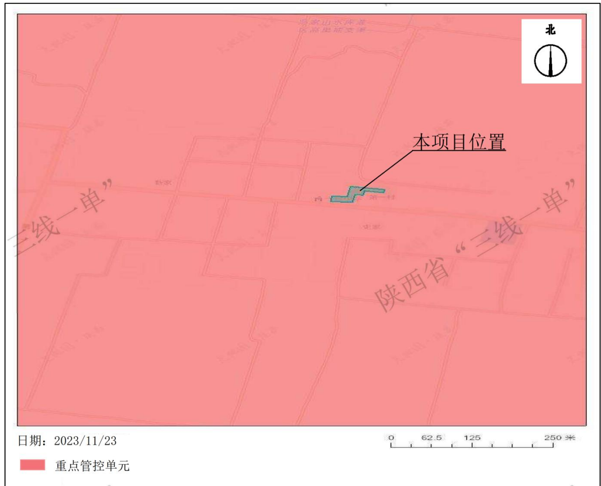
图1-1项目与宝鸡市生态环境管控单元对照分析示意图

由陕西省“三线一单”数据应用系统中冲突分析导出的陕西省“三线一单”生态环境管控单元对照分析报告可知（见附件5），本项目所处环境管控单元为渭滨区重点管控单元4，不涉及优先保护单元和一般管控单元。本项目与宝鸡市生态环境管控单元对照分析示意图见图1-1。