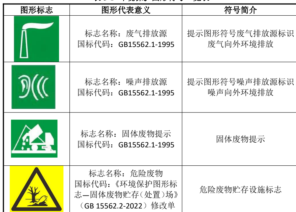
表 5-1 环境保护图形符号一览表

在厂区的噪声排放源、固体废物贮存处置场应设置环境保护图形标志，图形符号分为提示图形和警告图形符号两种，分别按 GB15562.1-1995、GB15562.2-1995 及《环境保护图形标志—固体废物贮存（处置）场》（GB15562.2-1995）修改单执行。