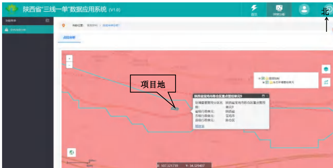
图 1-1 项目与生态环境管控单元对照分析示意图

通过陕西省“三线一单”数据应用系统平台进行冲突分析，本项目（不含办公室面积，租用公共办公楼）位于生态环境管控单元中重点管控单元。项目与生态环境管控单元对照分析示意图如下。