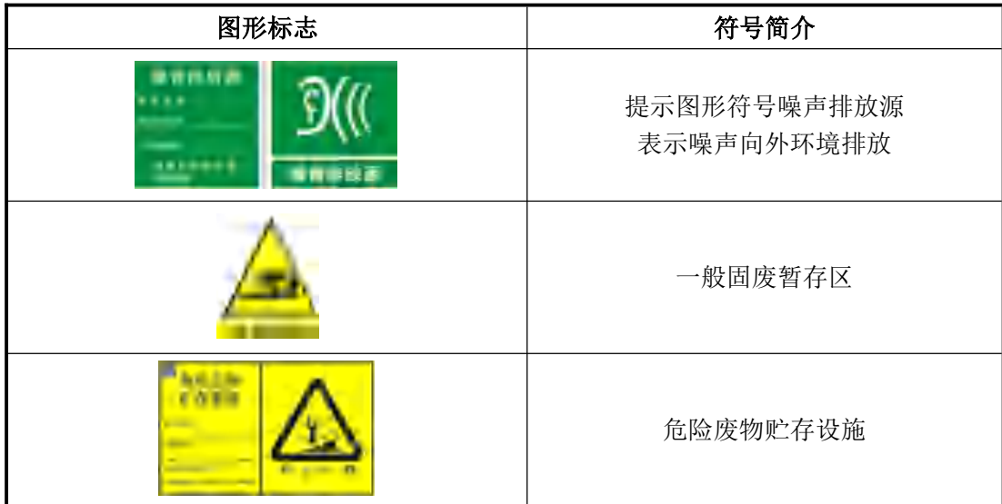
5-1 环境保护图形符号一览表

在厂区的噪声排放源、固体废物贮存处置场应设置环境保护图形标志，环境保护图形符号见下表。